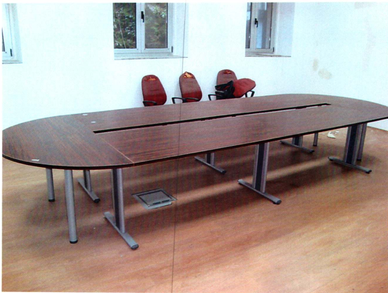
16. STOL, ovalni, konferencijski