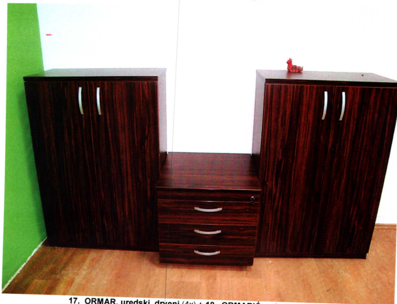
17. ORMAR, uredski, drveni (4x) + 18. ORMARIĆ sa ladicama (1x)