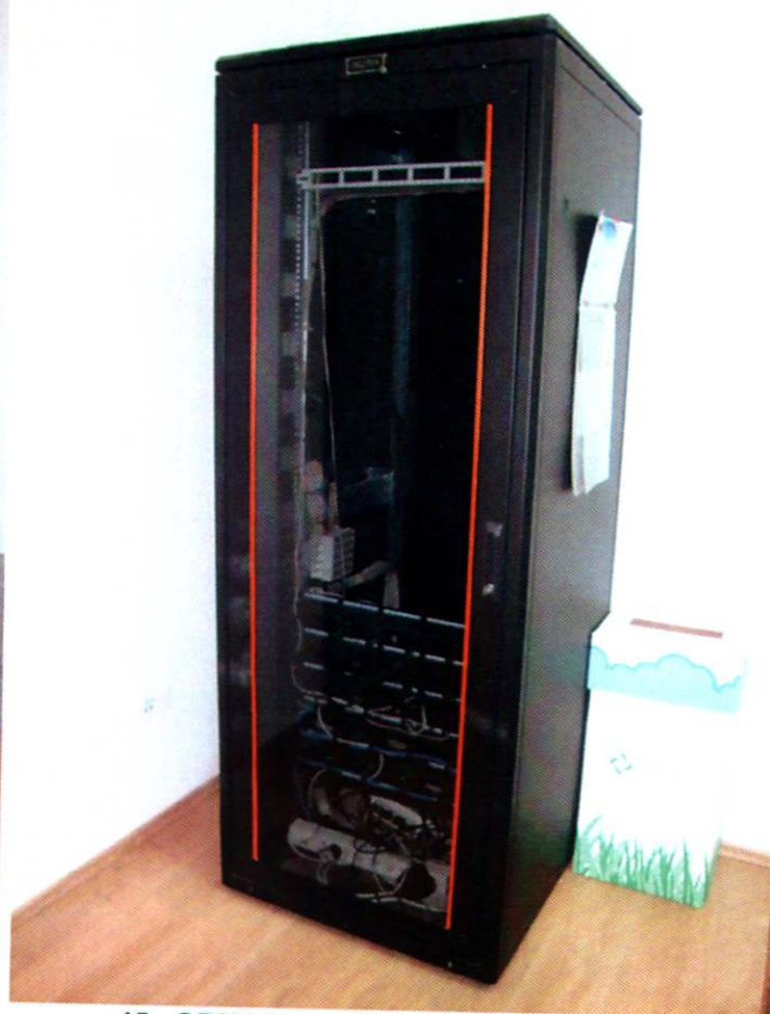
15. ORMAR za server, DIGITUS (prazan)