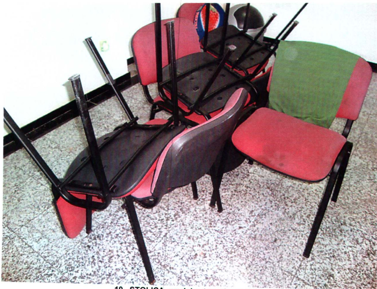
19. STOLICA, uredska, tapecirana (19x)