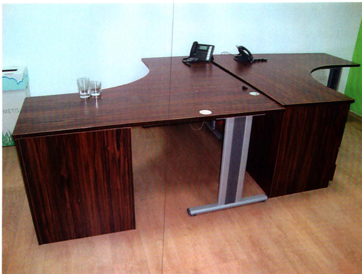
14. STOL, uredski, drveni (2x)