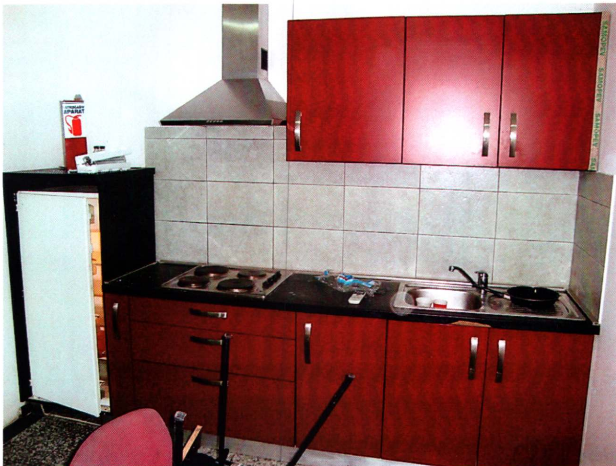
12. ČAJNA KUHINJA + Sudoper + Hladnjak