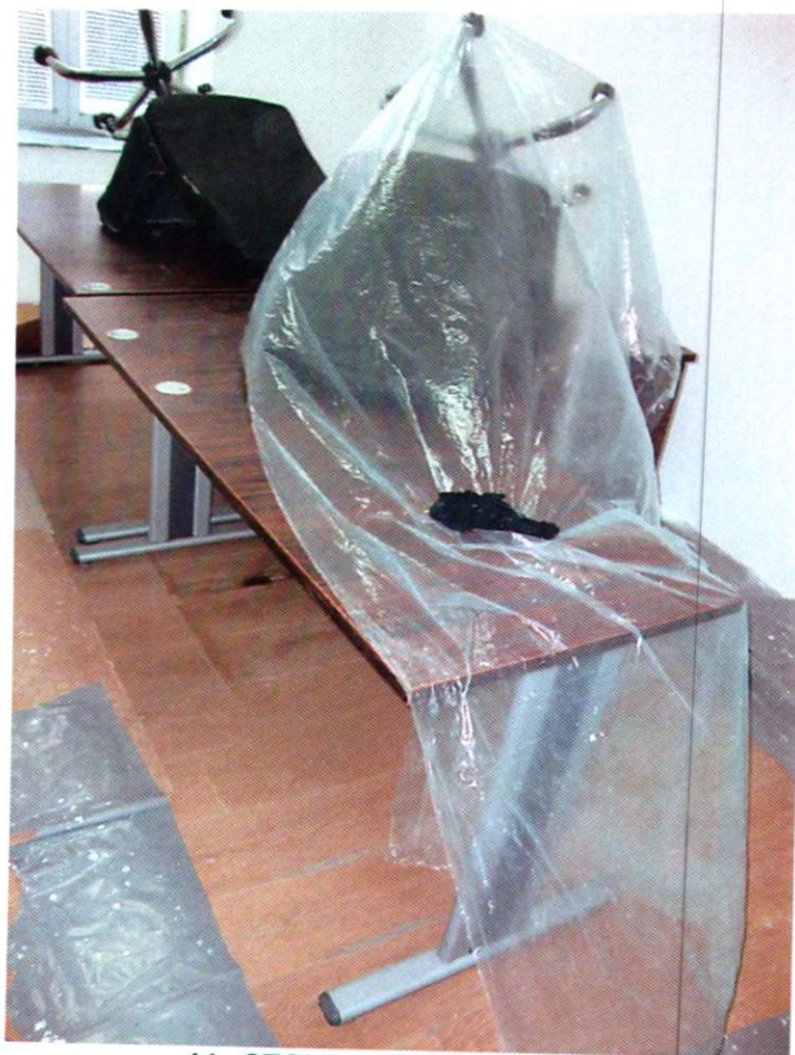
14. STOL, uredski, drveni (2x)