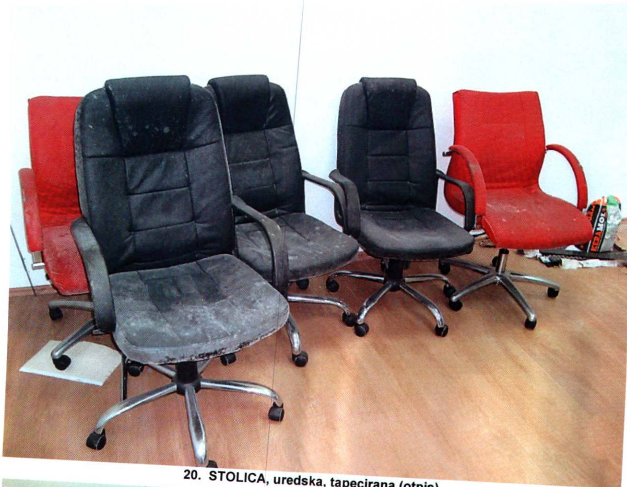
20. STOLICA, uredska, tapecirana (otpis)